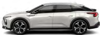
BIELÁ NACRÉ (P)