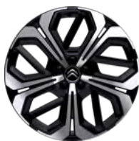
DISK Z ĽAHKEJ ZLIATINY 19" AERO-X BLACK DIAMOND