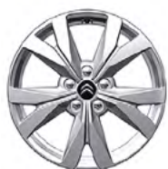
DISK Z ĽAHKEJ ZLIATINY 17" VORTE-X