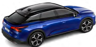
MODRÁ MAGNETIC (M)