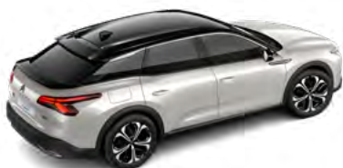
BIELÁ NACRÉ (P)