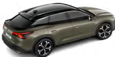
SIVÁ AMAZONITE (M)