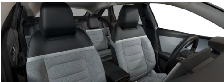
INTERIÉR URBAN GREY (v sérii pre Feel Pack)