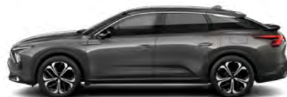
SIVÁ PLATINUM (M)