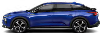
MODRÁ MAGNETIC (M)