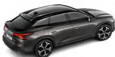
SIVÁ PLATINUM (M)

(M) – metalická farba karosérie, (P) – perleťová farba