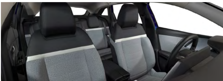
ŠTANDARDNÝ INTERIÉR LÁTKA CHEVRONS SIVÁ/LÁTKA ČIERNA (v sérii pre Feel)