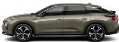
SIVÁ AMAZONITE (M)