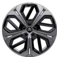
DISK Z ĽAHKEJ ZLIATINY 19" AERO-X