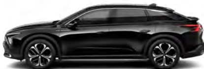
ČIERNA PERLA NERA (M)