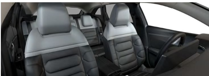
INTERIÉR METROPOLITAN GREY (v sérii pre Shine)