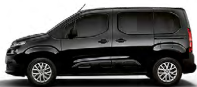
ČIERNÁ PERLA NERA (M)