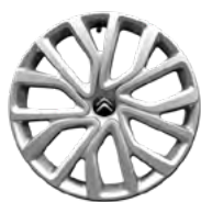
OZDOBNÝ KRYT 16" TWIRL (s čiernym stredom)