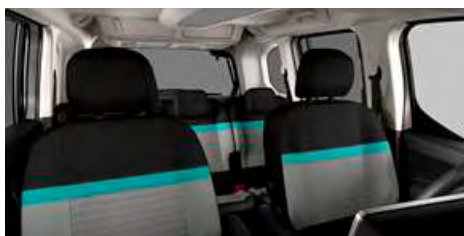
LÁTKA METROPOLITAN GREY (OFFT)