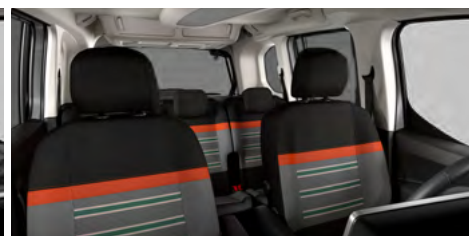
PACK XTR S POŤAHOM WILD GREEN (OGFR)