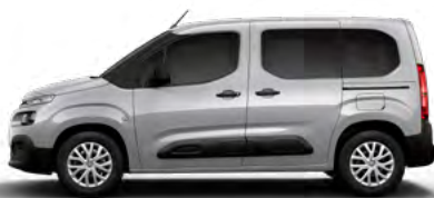
SIVÁ ARTENSE (M)