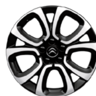
DISK Z LAHKEJ ZLIATINY 17" SPIN