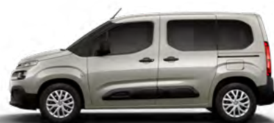
BÉŽOVÁ SABLE (M) (Nie je možné objednať pre LIVE PACK)