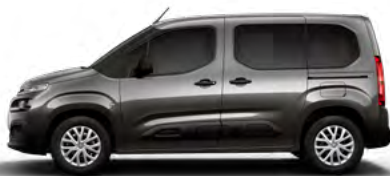
SIVÁ PLATINUM (M)