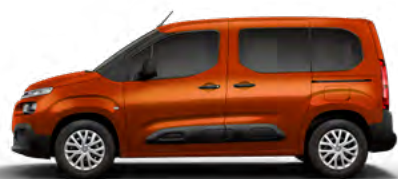
HNEDÁ CUPRITE (M) (Nie je možné objednať pre LIVE PACK)

M – metalická farba; N – nemetalická farba