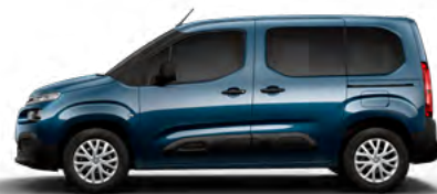
MODRÁ NUIT (M) (Nie je možné objednať pre LIVE PACK)