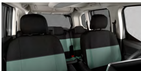
LÁTKA MICA GREEN