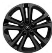
DISK Z LAHKEJ ZLIATINY 16" STARLIT