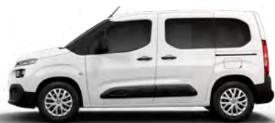
BIELA BANQUISE (N)