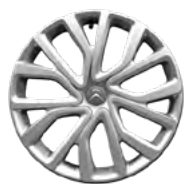
OZDOBNÝ KRYT 16" TWIRL