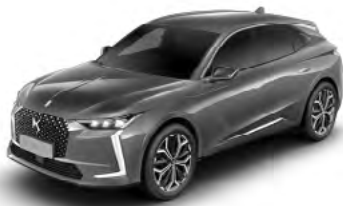
Sivá Platinium (M)