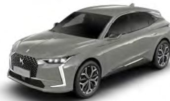
Sivá Laqué (M)