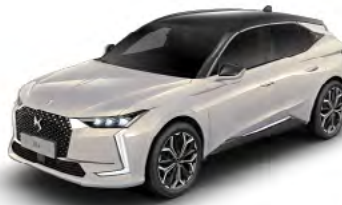
Sivá Cristal Pearl (M)