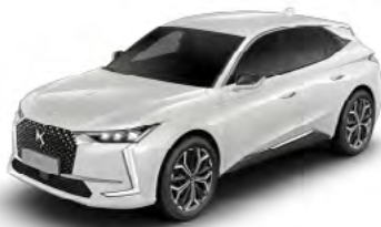
Bielá Perleť (P)