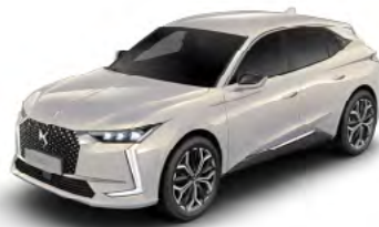
Sivá Cristal Pearl (M)