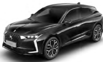
Čierna Perla Nera (M)