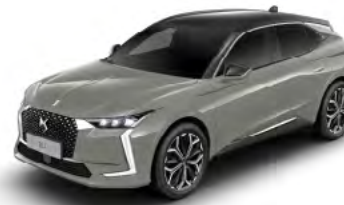
Sivá Laqué (M)