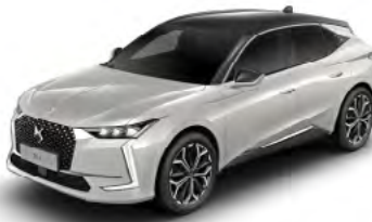
Bielá Perleť (P)