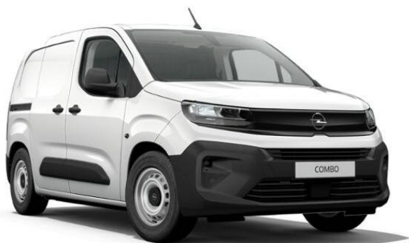
Biela Kaolín (PRPO) 0 €