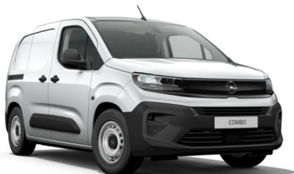
Šedá Kontrast (F4M0) 450 €