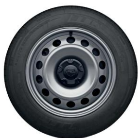
15" / 16" ocelové disky