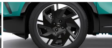
18" disky z ľahkých zliatin BiColor s 5 lúčmi (ZHRT)