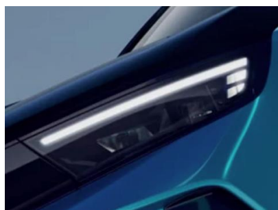
Intelli-Lux LED® pixelové svetlo

Opel Pure Panel® s najnovšími technológiami, plne digitálny 10-palcový informačný displej