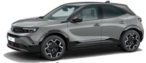
Šedá Grafik (SDP0) 550 €