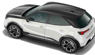
Čierna strecha Karbon (JD20) 500 € / GS štandard Čierna kapota Karbon Black (7N02) – GS 350 €