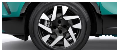
17" disky z ľahkých zliatin BiColor s 5 dvojitými lúčmi (ZHT9/ZHP8)