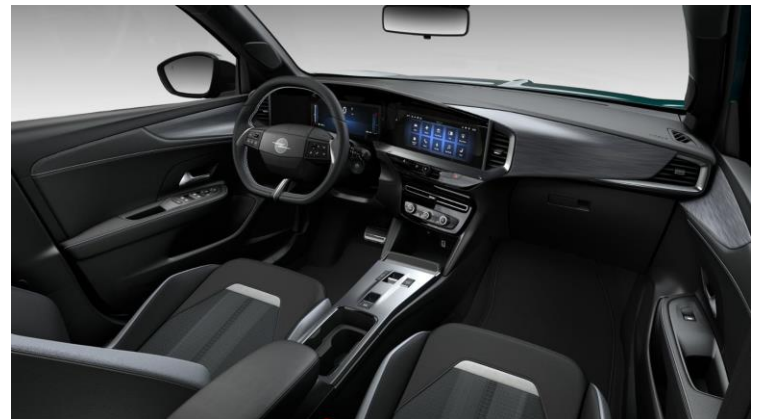
Čalúnenie čierne kombinácia látky/Premium imitácia kože „Fokus“, ozdobné lišty v kovovom vzhľade a čierne kožené vložky dverí (EHFX) – GS – 0 €