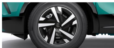
16" oceľové disky s dvojfarebnými krytmi (ZHR5)