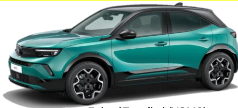
ZelenáTropikal (YQM0) 550 €