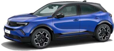
Modrá Kolibri (6ZM0) 550 €