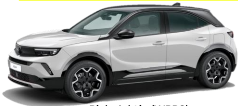
Biela Arktis (WPP0) 0 €