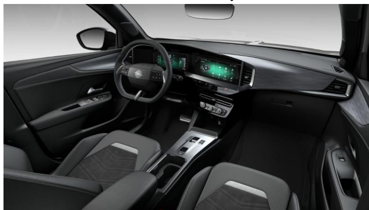
Čalúnenie čierne velúrové „ReNewKnit“ z recyklovaného materiálu, komfortné sedadlo vodiča s masážnou funkciou, GS – 750 €