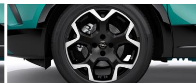
18" x 7,0J disky z ľahkých zliatin BiColor s 5 lúčmi (ZHQ1)