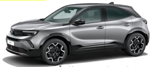
Šedá Kontrast (F4M0) 550 €