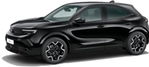
Čierna Karbon (9VM0) 550 €