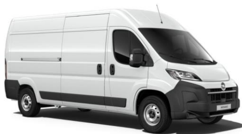
Biela Kaolin (PRP0) 0 €