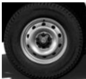
15" ocelové disky