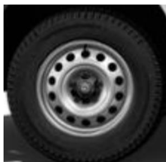
16" ocelové disky pre verzie HEAVY