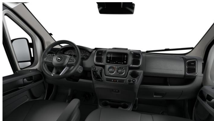
Látkové čalúnenie Premium Cab (BUFX)