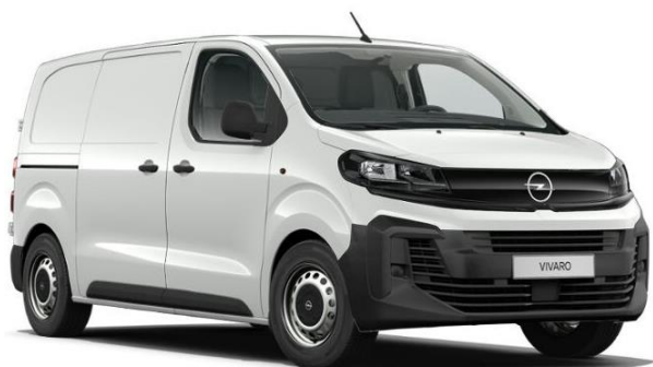
Biela Kaolin (PRPO) 0 €