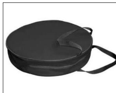
Taška na nabíjacie káble