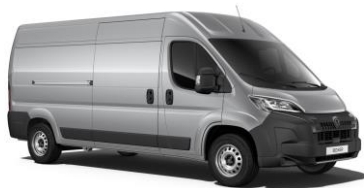
Sivá Artense (Steel) - metalická