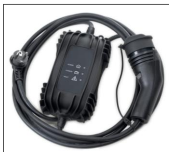
Štandardný kábel pre zapojenie do domácej 230V zásuvky 98 505 251 80