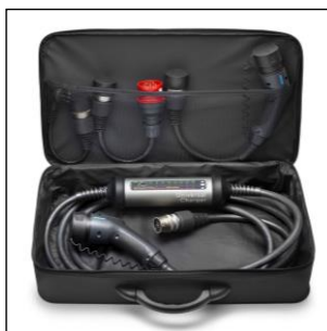
Súprava s nabíjacou jednotkou pre zapojenie do viacerých druhov elektrickej siete (230V/400V/WallBox) 98 460 314 80