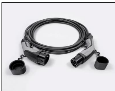
Kábel režimu 3 pre pripojenie do nabíjacej stanice (domáceho WallBoxu alebo verejnej stanice)