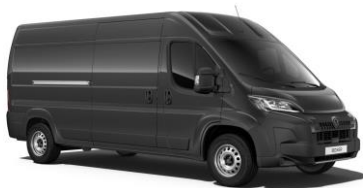
Sivá Graphito (čierna) - metalická