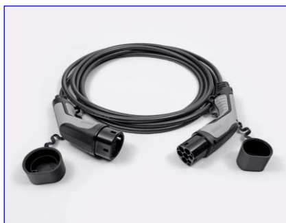
Kábel režimu 3 pre pripojenie do nabíjacej stanice (domáceho WallBoxu alebo verejnej stanice)