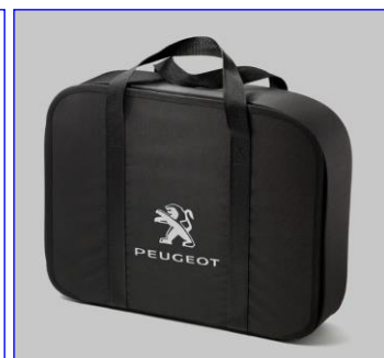
Taška na nabíjacie káble Peugeot 98 493 006 80