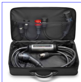
Súprava s nabíjacou jednotkou pre zapojenie do viacerých druhov elektrickej siete (230V/400V/WallBox) 98 460 313 80