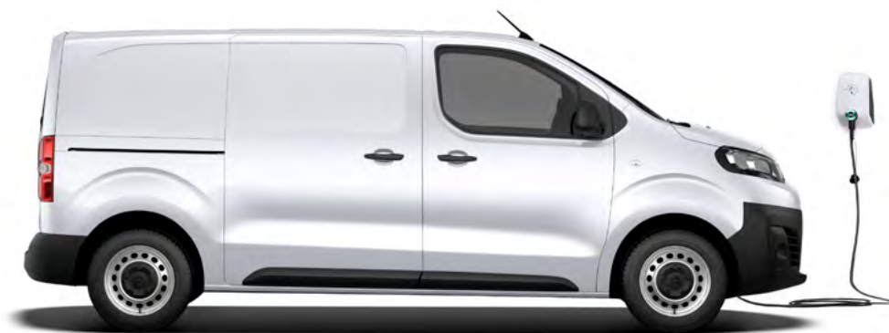
Dobíjanie striedavým prúdom pomocou WALLBOX-u.